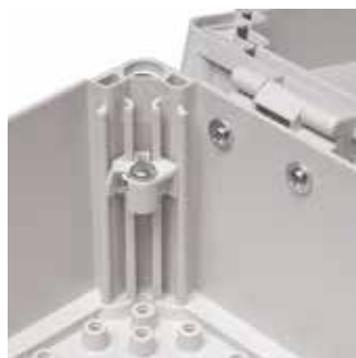
I Ensto Cubo O, C och W-kapslingar finns justerbara hörnhissar för underdelens hörnspår, vilket tillåter monteringen av plattor på valfri höjd.