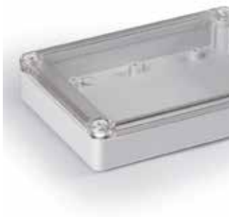
Ensto Cubo S -kapsling med ett lågt (10 mm) lock och en låg (25 mm) bas.