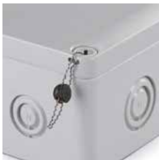
Locket av Ensto Cubo S -kapslingen kan plomberas med en standardlockskruv.