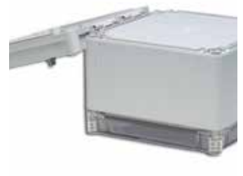
Locket kan monteras på baksidan av Ensto Cubo O-,C- och W-kapslingens underdel.