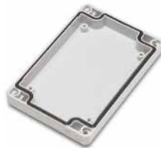
Ensto Cubo D -kapslingarna har fästklackar på lockets insida.