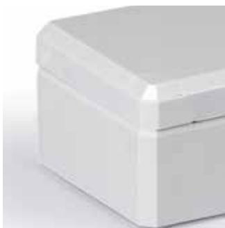
Ensto Cubo D -kapslingarna har en modern utformning med fasetterade hörn och täckproppar.