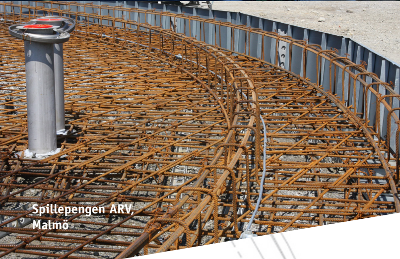
Spillepengen ARV, Malmö

Reservoar för reservvatten samt pumphus. Centrallasarettet, Västerås. Dimensioner: invändig diameter 14,9 m, höjd 8,0 m