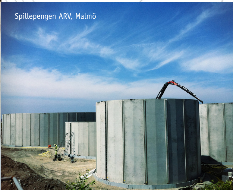
Spillepengen ARV, Malmö