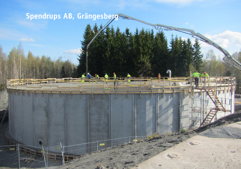
Spendrups AB, Grängesberg

Utjämningskank för Spendrups AB, Grängesberg. Kombination av prefab och platsgjutet betongtak.