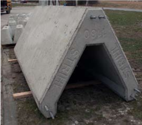
STRIHL V-foundation – Lättviktaren