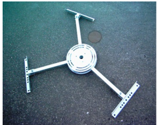
Runtomsträlände fäste 1-8 armar