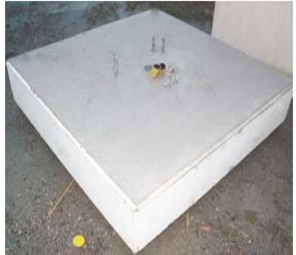
Betongblock finns i 2 modeller (Ej CE-märkta) 2,4 ton; L: 1,7m x B: 1,7m x H: 0,35m 1,5 ton; L: 1,45m x B: 1,45 x H: 0,30m