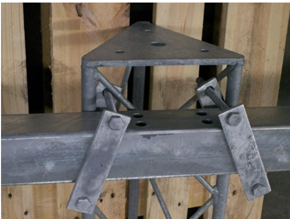
Strålkastarbalk 1m, 2m, 3m