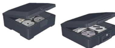
Brandboxar, 2 storlekar