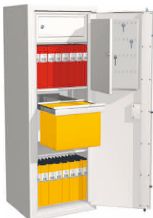
JS1600 med inredning