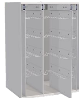
Nyckelkasset 192 krok (Passar ej till JS680)