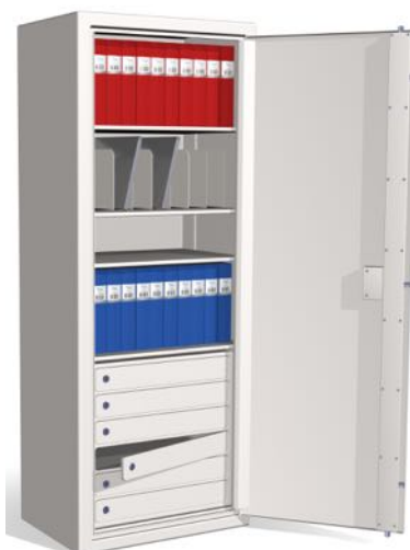
JS1900W med inredning