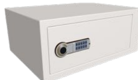
Låsbart fack med kodlås H190 x B440 x D310 mm