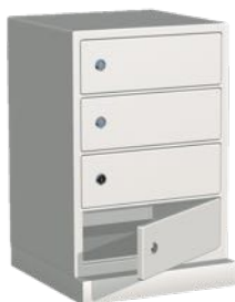
Fackmodul, 4 fack H583 x B450 x D390 mm (Passar ej till JS680)