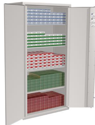
JS100 för cigarettförvaring