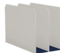
Laptothållare, 2 fack H225 x B150 x D320 mm