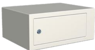
Låsbart fack, 150 mm. H190 x B440 x D310 mm