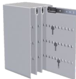
Nyckelkasset 168 krok