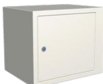
Låsbart fack, 340 mm. H380 x B445 x D340 mm