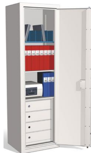
JS1900 med inredning